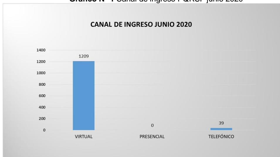
Gráfico N° 1 Canal de ingreso PQRSF junio 2020