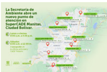
PUNTOS DE ATENCION.jpg 97K