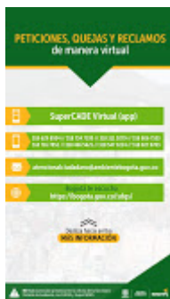
Canales de atención SDA.jfif 99K