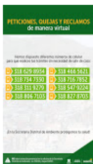
Lineas de Atencion Telefonica SDA.jfif 112K