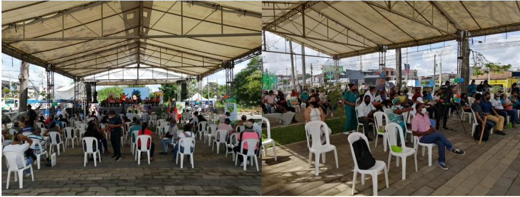
Celebración día Comunal Municipio de Carepa