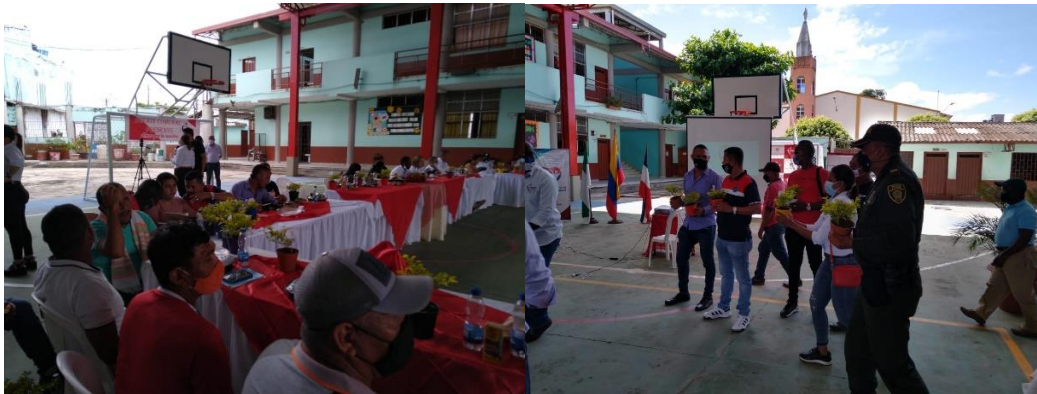
Celebración día Comunal Municipio de Granada