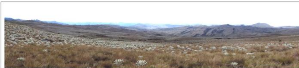
Fotografía 1. Panorámica del ecosistema de páramo ubicado en el área de análisis para el proceso de soporte técnico para la declaratoria como nuevas áreas protegidas en ecosistemas de alta montaña, correspondiente a la parte alta de la cuenca del Río Blanco Localidad 20 Sumapaz Distrito Capital de Bogotá.

Para la consolidación de documentos técnicos de soporte relacionados con el cumplimiento de la meta, la Subdirección de Ecosistemas y Ruralidad – SER de la Secretaría Distrital de Ambiente, emite informes y conceptos técnicos relacionados con: a) la incorporación de nuevas áreas protegidas en ecosistemas de alta montaña (páramos y bosques alto andinos) dentro de la ruralidad del Distrito Capital; b) El alinderamiento de ríos, quebradas, canales, humedales y demás elementos de la Estructura Ecológica Principal – EEP dentro del perímetro urbano del Distrito Capital; c) la afectación a los elementos de la Estructura Ecológica Principal - EEP y los componentes del sistema hídrico del Distrito Capital. A esta meta se integran los propósitos contemplados en instrumentos como la Política de Suelo de Protección para el Distrito Capital, el Plan de Ordenamiento Territorial – POT y la Política para la Gestión de la Conservación de la Biodiversidad en el Distrito Capital, que determinan directrices relacionadas con la designación, delimitación, declaratoria, el manejo ambiental, la garantía y conservación de los atributos ambientales y ecológicos del territorio, así como la continuidad y aumento de los servicios ecosistémicos, la reducción de la fragmentación ecológica y el mejoramiento de hábitats y conectividad ecológica al interior del Distrito Capital y de éste con la región.